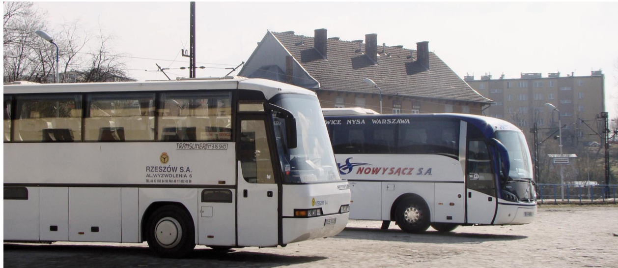
Każde państwo jest zobowiązane do prowadzenia krajowego rejestru elektronicznego przedsiębiorców transportu drogowego

Ponadto poinformowano, że – wbrew częstym sugestiom organów kontrol-